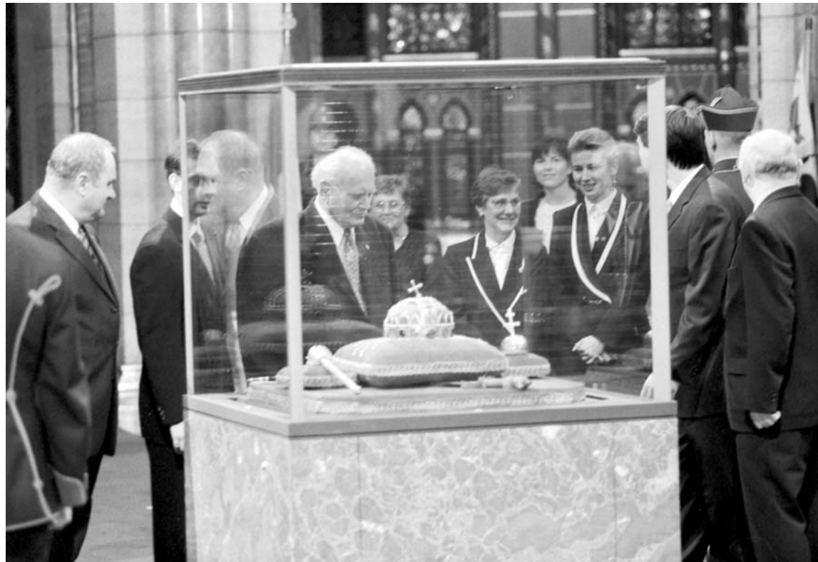
Megérkezett a korona az országháza, s ezután a kupolában elhelyezve, különleges védőrizettel ellátva folyamatosan látogathatóvá vált

Lemond Györgyi Kálmán. A legfőbb ügyész indoklás nélkül távozik posztjáról, s ennek nyomán többféle