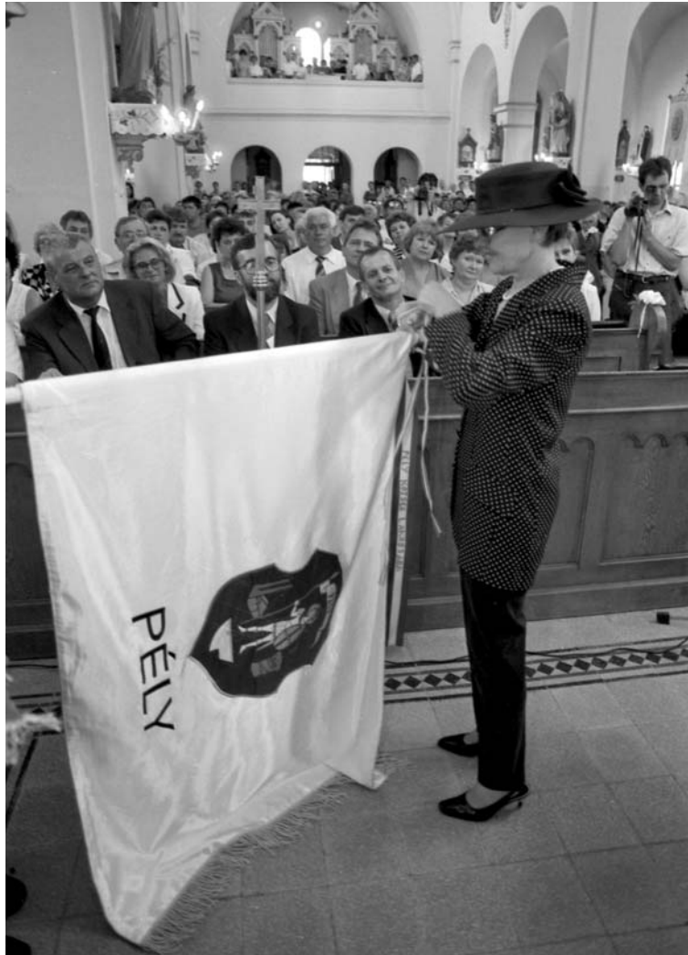
Egész évben zászlószentelés; Töröcsik Mari szülőfalujának, Pélynek millenniumi zászlóátadási ünnepségén vesz részt

MSZP és a Fidesz között – a szocialisták javára. Decemberben sem mutatkozott eltérés, továbbra is maradt a 10 százalék fölötti szocialista előny. Pedig a szocialista párt házatáján nem történt semmi, ami növelhette volna a népszerűségüket.