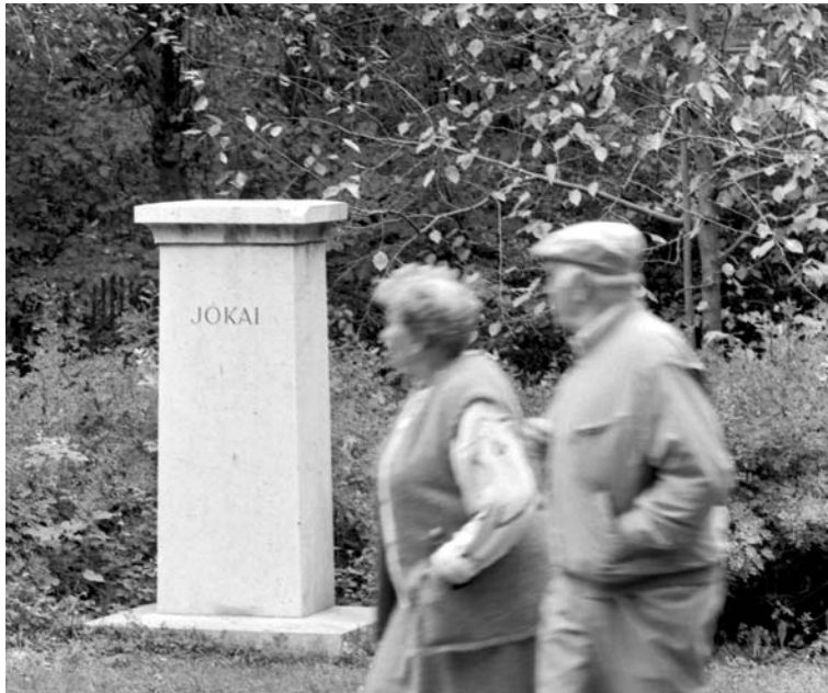
Színesfém tolvajok rendszeresen fosztogatják a margitszigeti szobrokat: Jókainak is hűlt hely van

1988 1989 1990 1991 1992 1993 1994 1995 1996 1997 1998 1999 2000 2001 2002 2003 2004 2005 2006 2007 2008 2009