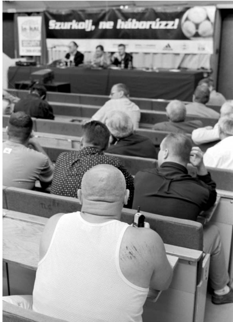
A vezérszurkolók legelső országos kongresszusán azon tanakodnak, hogyan vethetnének véget a futballpályákon eluralkodó erőszaknak?

ható, hogy a diktatúra évtizedei alatt megroppantott nemzetudatot semmihez nem foghatóan nagy erővel intézményesített kampányok végtelen folyamával törekedtek újból egészségessé – és kereszténnyé – varázsolni. A szimbolikus politizálás olyan intenzitást öltött, amelyre legfeljebb csak a legidősebb korosztályok tagjai emlékezhetek, a