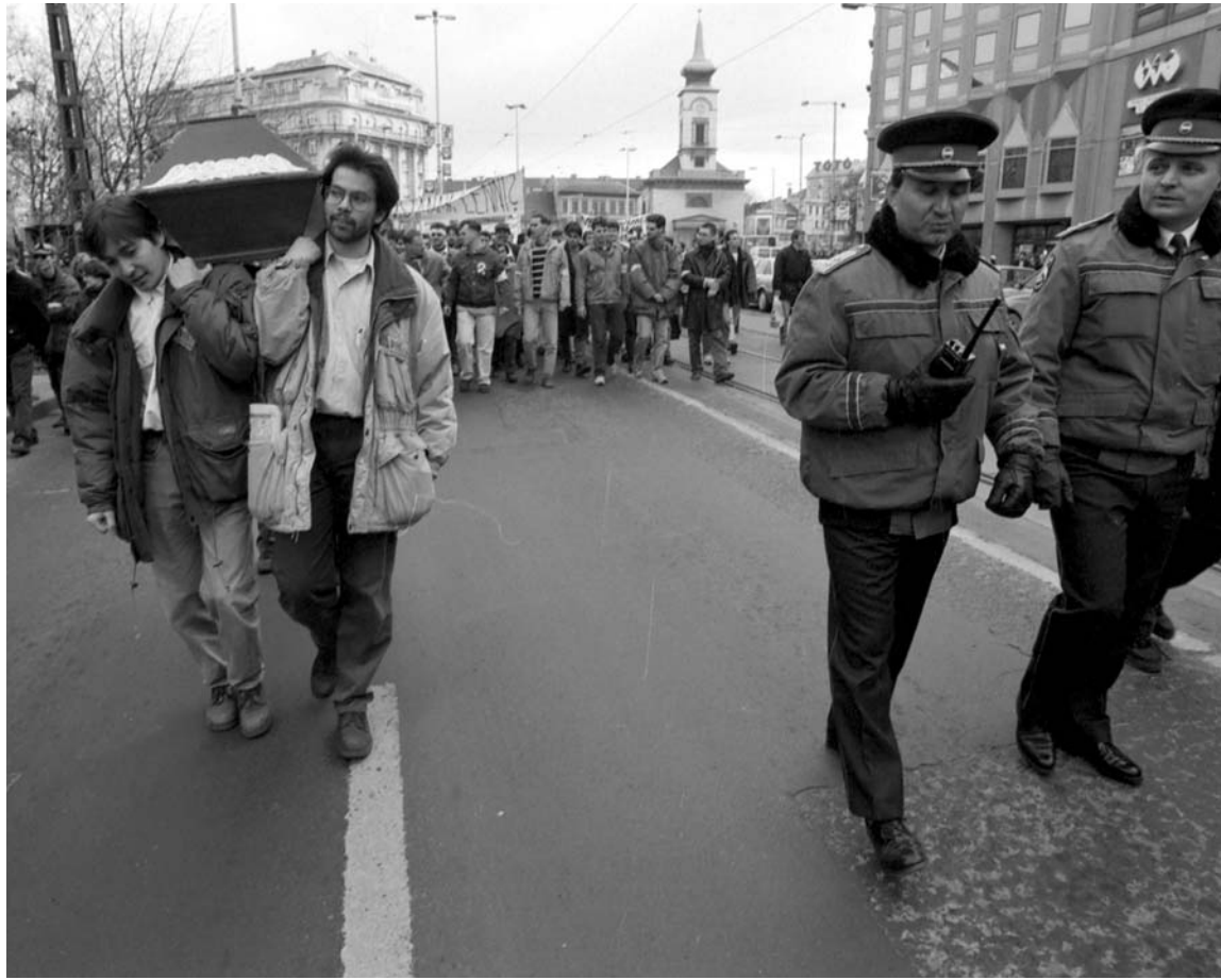
A hallgatói önkormányzat képviselői hátukon viszik a magyar felsőoktatás koporsóját... Vezetésükkel a tandíj bevezetése ellen tiltakozó egyetemisták ezrei vonulnak a pénzügyminisztérium elé

A három hónapos koalíciós válság kezdete. Horn Gyula egy tévéinterjúban bejelenti az általa kívánatosnak gondolt kormányzati átalakítás kereteit és személyi feltételeit. E nyilatkozattal mintegy negyedéven keresztül tartó kölcsönös üzengetés, fenyegetőzés, szelidebb és durvább politikai zsarolási akciók sorozata veszi kezdetét. Az SZDSZ-nek folyamatosan lehetősége nyílik koalíciós partnersége tényleges súlyának tesztelésére, Horn Gyula pedig újra és újra megismerheti kormányfői szuverenitásának határait. A közvélemény által nehezen átlátható szóbeli háborúskodás szeptember 28-án ér véget, kölcsönös engedmények jegyében.