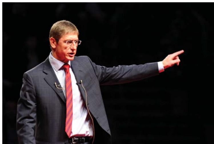
Gyurcsány Ferenc utat mutat a koalíciós partnernek... Az MSZP március 29-ei rendezvényén az SZDSZ-t hibáztatta a népszavazási kudarcért

Május tájékán a kedélyek lassan megnyugodtak, s valamennyi politikai főszereplő megkezdte berendezkedését a kisebbségi kormányzás keretei között eltöltendő utolsó két év minél sikeresebb elviseléséhez.