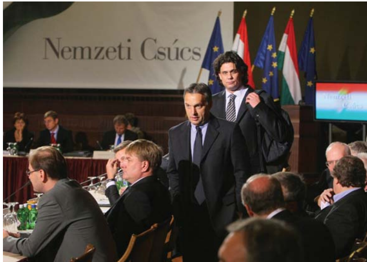
Nyugi, mindjárt a csúcson leszünk... A Fidesz delegációja megérkezik az októberi Nemzeti Csúcsra

Mindenkit meghívtak, aki csak számított. Október 18-án a politikai, gazdasági és tudományos élet legkiemelkedőbb vezetői a válságról tanácskoztak