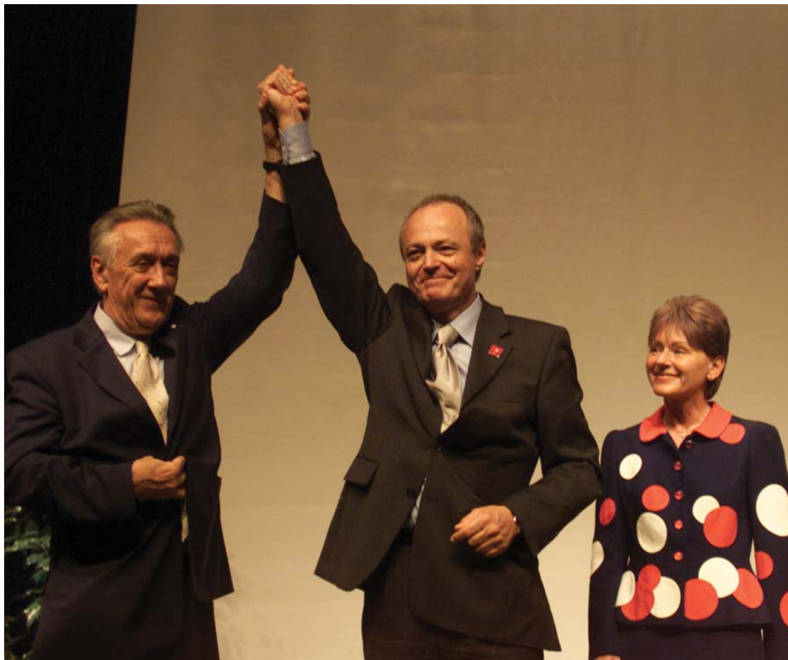
Az MSZP júniusi kongresszusán a pártönkívüli Medgyessy Pétert választották miniszterelnök-jelöltté, így ő lett a kampányt irányító OVB vezetője is

A kedvezménytörvény ideiglenes munkavállalást könnyítő rendelkezései minden román állampolgárra vonatkoznak – így állapotott meg Orbán Viktor a román miniszterelnökkel. A kormányfői óvatlanság következtében „húszmillió román munkavállaló” rohamával kell nem is oly soká szembesülnünk – állítják néhány nappal később a szocialisták, nem kis médiafelhajtással kísérve ezt az akciót. A leendő választásokat megelőző kampány ezzel a lehetséges legnagyobb sebességbe kapcsol. Néhány nappal korábban kezdtük el az új évet.