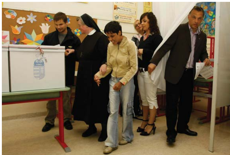
Sokszínű Magyarország: Orbán Viktor leadja szavazatát a június 7-ei uniós választásokon

Mindezen előzményekhez képest április közepétől Bajnai Gordon kormánya meglepően gyorsan feltalálta magát, és mindenféle kedvezőtlen körülmény ellenére két és fél hónap alatt meghozta mindazokat a döntéseket, amelyek nagy részére korábban a koalíció évekig nem volt képes. A nyár végére mind belföldön, mind pedig külhomban lényegbevágóan változott meg a kormány körüli hangulat. Az őszi költségvetési vitának már úgy vághattak neki, hogy a válság előtti szinten sikerült stabilizálni a forint árfolyamát, helyreállt az ország külső finanszírozási háttere, folyamatosan csökkent az irányadó kamat, a BUX-index határozott javulást mutatott, s teljesíthetőnek látszott az államháztartási hiánycél is. Más szóval, a közvetlen pénzügyi-gazdasági összeomlás elkerülésében ez a kormány mindenképpen jó teljesítményt nyújtott, s ez még akkor is elis-