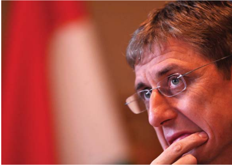
Mekkora legyen a meglepetés? A januári rendkívüli parlamenti ülésen elmondandó beszédére készül a kormányfő

2009 2008 2007 2006 2005 2004 2003 2002 2001 2000 1999 1998 1997 1996 1995 1994 1993 1992 1991 1990 1989 1988