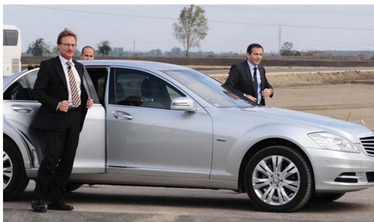
Magyar és német vezetők közösen elhelyezik a kecskeméti Mercedes-nagyberuházás alapkövét

hasonlatos, s a munkanélküliségi adatok is kedvezőtlen tendenciát mutattak.